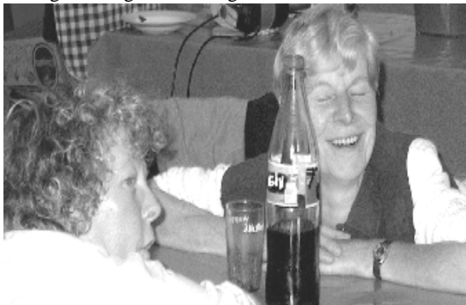
Foto gemaakt door een pinkeltje dat 'snachts wakker werd door het lawaai van deze tooghangende kookmoeders

We besluiten dan ook eens een kijkje te gaan nemen op de plek waar de boosdoeners van dit alles schuilen voor het felle daglicht en piepen voorzichtig door de gapende opening. Naast een hoop omvergelopen faliezen en rondslingerende pikante kledij, is er echter niemand. Plots horen we buiten een wagen met een handrembocht het plein opgieren. Onder veel te luid bonkende 'muzikale' deuntjes strompelen 9, in de fleur van hun leven zijnde vrouwen en één man met baard uit een groene feestbus. Ze lijken allemaal zwaar bezopen. Tot grote opluchting zien we achter het stuur nog een andere (ingehuurde) man die zo vriendelijk was om deze nachtraven huiswaarts te begeleiden. En ja zelfs na een zwaar nachtje stappen, lijken ze nog niet uitgefeest. Dag en dauw verandert dan ook al gauw in ochtendspauw.