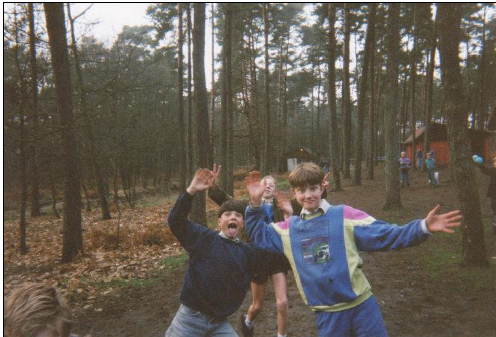
Malpertuus, de anders zo rustieke omgeving, vormde de locatie van deze tragedie...