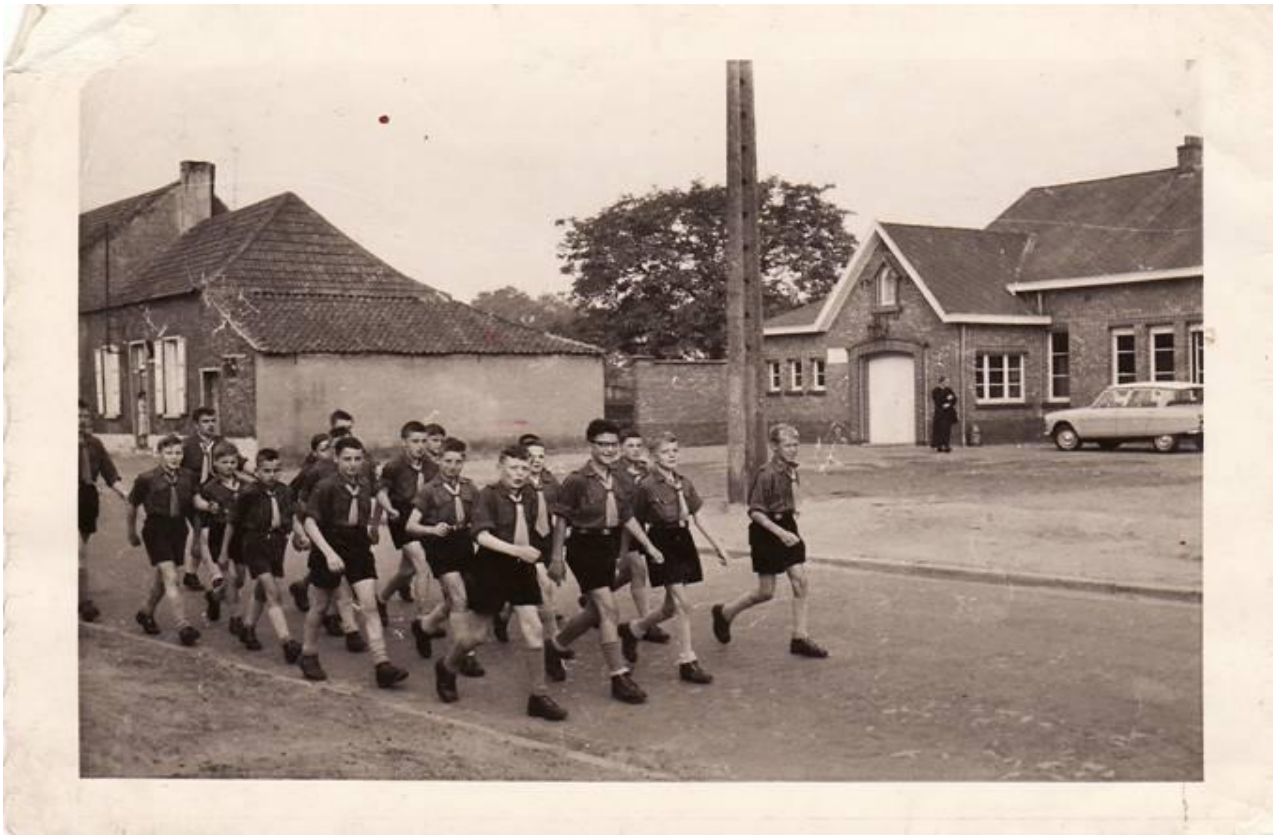
Al zingend op tocht ...