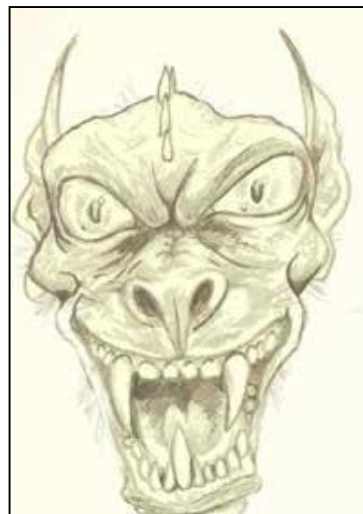
De robotfoto van Den Bok, die achteraf op basis van de getuigenissen werd gemaakt.